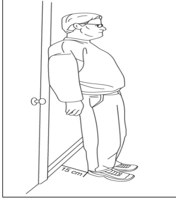
Tilt egzersiz programında uygulanacak egzersiz

Bayılma ataklarını azaltabilmek amacı ile evde bu egzersiz programını uygulayabilirsiniz. Çocuğunuzun ayakları duvardan 15 cm uzakta olacak şekilde, sırtı duvara yaslanacak şekilde 20 dakika süre ile ayakta kalması gerekmektedir. Bu egzersizi günde 2 kez yapmanız önerilir. 3 ay süre ile bu programı uyguladıktan sonra doktorunuza tekrar başvurmanız gerekmektedir.